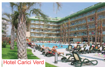
Hotel Carici Verd

Malgrat de mar - St. Susanna Der Ferienort Malgrat de mar ist mit St. Susanna verbunden und verfügt über einen breiten, langen Sandstrand. e Geschäfte, Bars, Restaurants und Discos sorgen für Unterhaltung und Spass! L'loret de mar Wenn Sie rund um die Uhr etwas erleben wollen, dann kommen Sie mit nach Lloret de Mar „DAS“ Feriencentrum an der Küste. Die Stadt ist Treffpunkt für Unternehmungslustige. Viele Sportmöglichkeiten (Wasserski, Surfen, Segeln, Tennis) reges Nachtleben und gute Bademöglichkeiten. Calella ist tourist. Hauptstadt der Costa del Maresme. Ein breiter, etwa drei Kilometer langer Sandstrand, von Felsen umgebene Buchten und viele Freizeitmöglichkeiten haben Calella zu einem beliebten Reiseziel gemacht. In zahlreichen Bars, Cafes, Restaurants u. Diskotheken finden Sie reichlich Abwechslung.