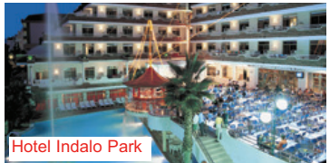
Hotel Indalo Park